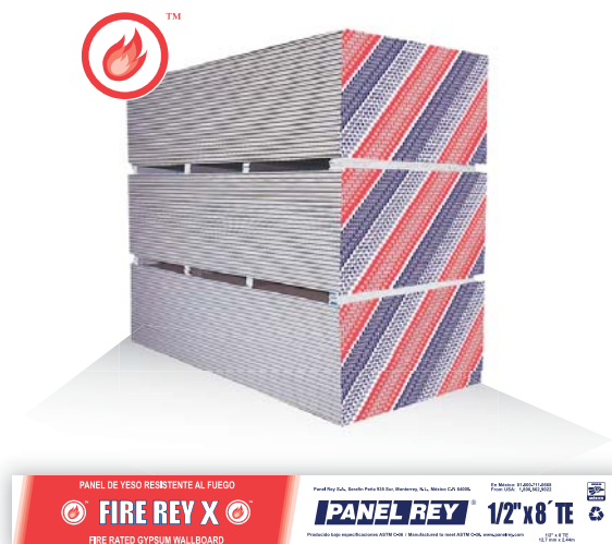
Cintilla para identificación de panel.

El panel de yeso Resistente al Fuego de Panel Rey® Tipo X es un producto consistente de un núcleo incombustible hecho esencialmente de yeso, reforzado con la adición de fibras resistentes a elevadas temperaturas que proporcionan mayor fuerza al panel y resistencia al fuego cuando se emplea en ensambles previamente evaluados. Está cubierto por ambos lados con papel 100% reciclado. El papel de la cara cubre las orillas biseladas del panel a todo lo largo para mayor fortalecimiento y protección del núcleo. Los extremos están cuidadosamente esmerilados en corte cuadrado. El panel de yeso Resistente al Fuego de Panel Rey® se ofrece en una variedad de longitudes y espesores estándares para su uso en la construcción. Los productos de Panel Rey® no contienen asbesto.