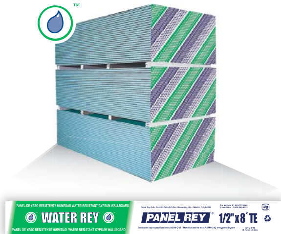
Cintilla para identificación de panel.

Los paneles de yeso no generan ni propician el crecimiento de moho y hongos cuando son transportados, almacenados, manejados, instalados y mantenidos adecuadamente. El panel debe estar siempre seco para prevenir cualquier desarrollo de microorganismos. Debe almacenarse en un área que lo proteja de las inclemencias del clima, inclusive en donde una obra está en proceso. Durante su tránsito debe protegerse con alguna cobertura en buenas condiciones. Las bolsas de plástico que cubren el panel están diseñadas para proteger únicamente durante el tránsito y deben retirarse inmediatamente una vez que llegue y se descargue el producto, de lo contrario se pueden propiciar condiciones favorables para el crecimiento de moho y hongos.