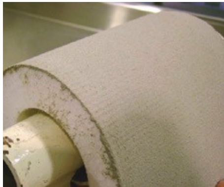
Prueba de Resistencia a la Flexión sin Agrietamiento