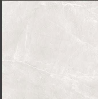
Gray GLB2 60.5 x 60.5 cm