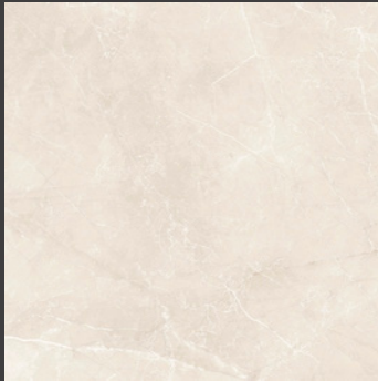
Beige GLB1 60.5 x 60.5 cm