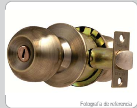
Fotografía de referencia