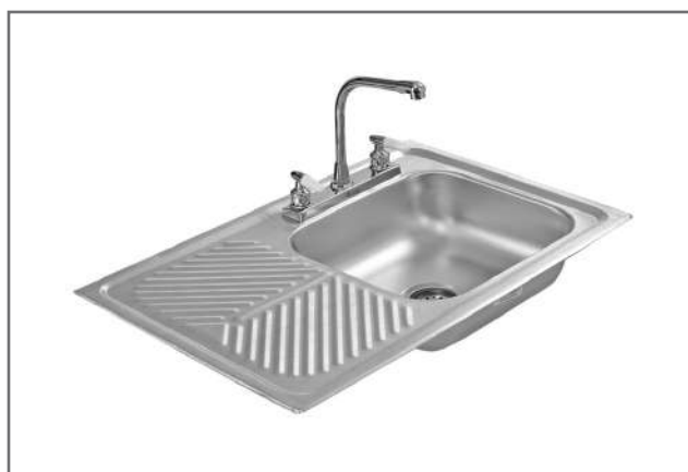
M-101 - Escurreidor lado izquierdo M-102 - Escurreidor lado derecho