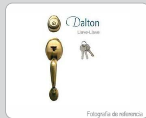
Fotografía de referencia